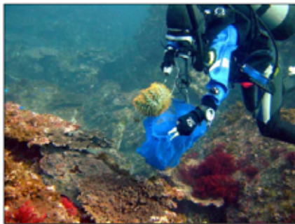
サンゴを食害するオニヒトデの駆除