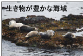
生き物が豊かな海域