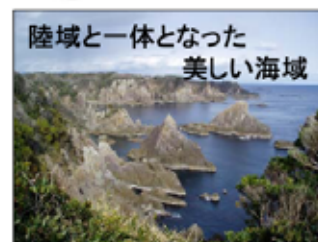
陸域と一体となった 美しい海域