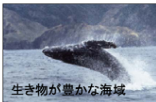
生き物が豊かな海域