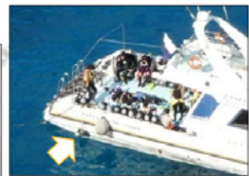
係留ブイ設置によるダイビング利用の適正化(アンカーによるサンゴの破壊防止)