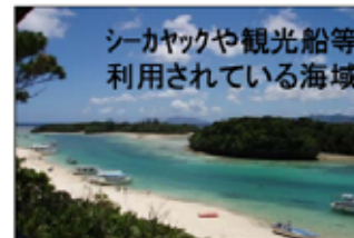
シーカヤックや観光船等 利用されている海域